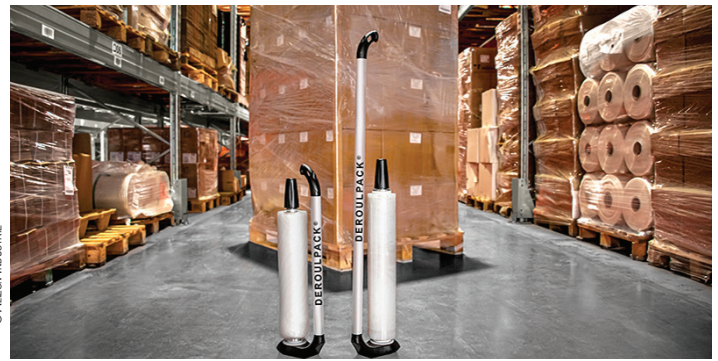
Alizon Industrie, expert en solutions d'emballage

L'entreprise, dont le siège social est implanté à Valence, travaille exclusivement pour des professionnels de tous secteurs d'activités. Afin de répondre à leurs be-